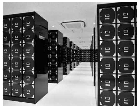
納骨壇（写真は1体用です）