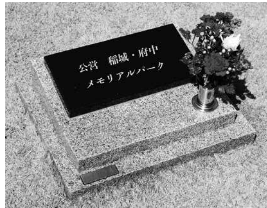
墓石（墓石のみ既に設置してあります） ※写真は家名等表示板、花立ての設置例です