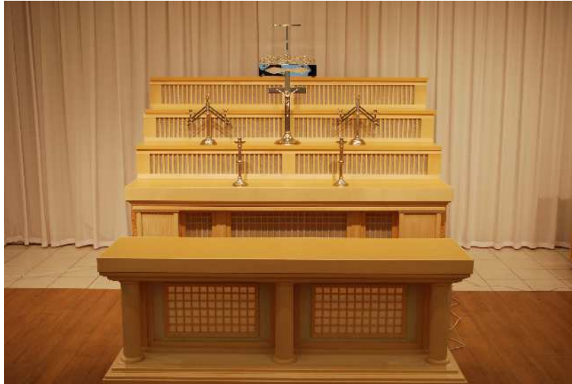
【キリスト教】 祭壇にかける黒布等をご用意ください