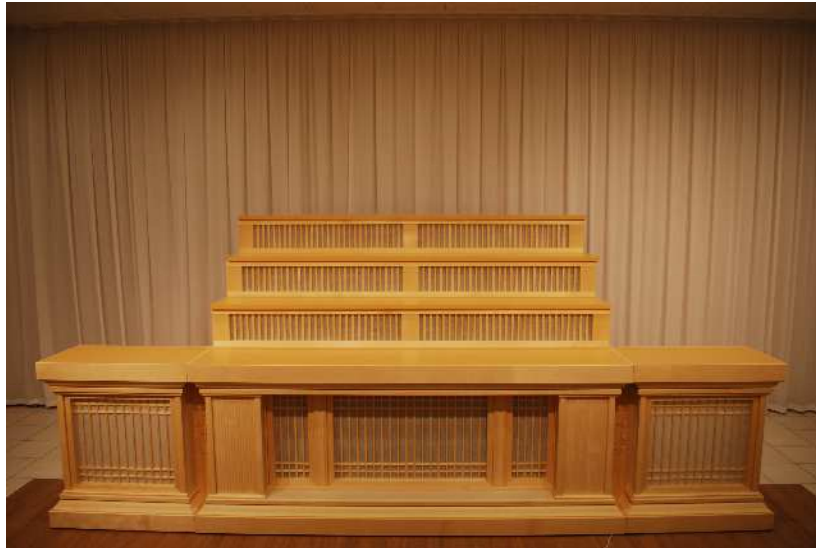
【無宗教・花祭壇】 祭壇にかける防水シートをご用意ください